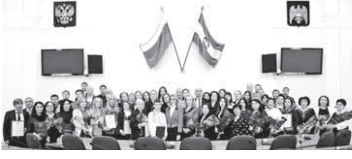
По традиции в канун Нового года в законодательном органе республики чествовали работников различных отраслей. За особые заслуги в профессиональной и общественной деятельности поощрены семьдесят человек отмечены почетными грамотами Парламента КБР и благодарностями Председателя Парламента Кабардино-Балкарии.