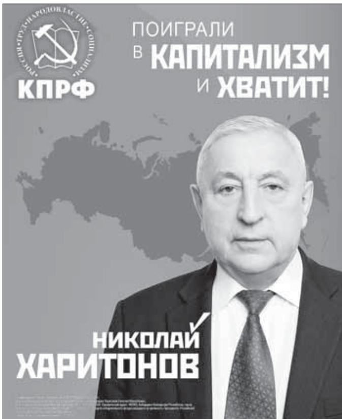
Агитационные материалы публикуются бесплатно на основании пункта 1 статьи 53 Федерального закона «О выборах президента Российской Федерации» (№19-ФЗ от 10.01.2003 г.)