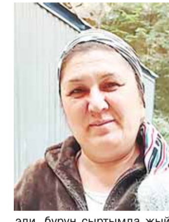
Ол аны жашауа кыймачылауу эди, бурун сыртымда жыйылган ирим кыйыма жетип, жашауу юзюлорге болуук эди. Сау болсула, мен аланы ёмюрюмде унутмам», - дегенди тишируу. Ол аны жашауа кый-

«Мен гайморитден кыйналып иги кесекни турганма. Бу жол а этим кызып, кече терк болушук берген машинаны чакырырга тошгонди. Келген врачна Нальчикде жуккыан аурууладан бакгыан болницага эптедиле. Анда врачла уа, олсагат кырап, аурууу тохташдырып, тийиш дарманла бла багып башлагандыла. Эрттенликке аурууну сынтыл болганды, халим да бир кесек игиге айланганды. Юйюме кетерге окууна тебирегенме, алай врачна кыймагандыла. Мен алаагы алай терк тюшмесем