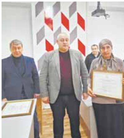
бла ёхтемленебиз эмда ала жууккы заманда хорлам бла махтаулу болуп кыайтыркыларына ишегибиз жоккы, – дегенди Кюлбай улу.

– Биз жерлешерибизни, чынтты эр кишиле-ча, батырлык этип, алгга таукел баргянарлары