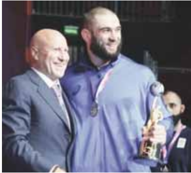
Россеини спорт тутушуудан федерациясындан билдиргенлерине кёре, Къабарты-Малкьардан гёжефге Олимпиаданы алтын майдалы берилликди. Саугалау Россеини эркин тутушуудан чемпионатыны кезиунюнде ётерикди, ол а 30 апрельде – 4 майда боллукьду.