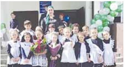
Башланган класстарда жер болганын билгенлери, бери келгениме. Ишге жангыдан кирген кономде кууанганым чакты бир кууанганым кесим да.

Алчыганд да эттеме. Алай а, мастер-классына келгенден кезинде ала мени келгендиринтерин, ышангандарын көргөндө, жорегимде кыоркуум кетип калган эди.