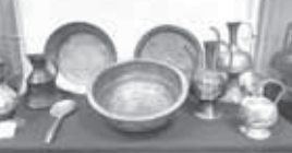
Маданият кой ачылганды берилгенди», – дейди тамата. Алай затпаны анып кыймай, апын турганды да хыччуну көрпөгөнгиди.