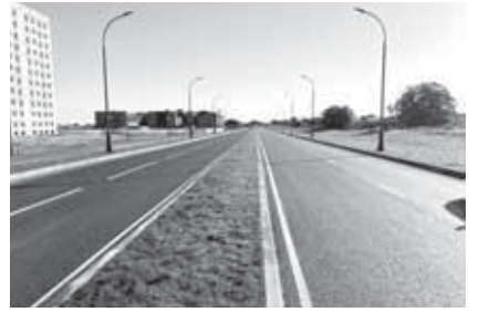
огромная работа, результатом которой стали более тысячи километров качественных дорог, улучшенная инфраструктура и повышенный уровень безопасности на дорогах. Подготовила Вероника ВАСИНА

Особое внимание уделяется столице Кабардино-Балкарии. Городская агломерация включает населенные пункты Нальчик, Хасанья, Белая Речка, Кенже и Адиох. За годы реализации дорожного нацпроекта отремонтировано около 82 улиц общей протяженностью почти 95 км: появились новые асфальтовые покрытия, качественные освещение, удобные тротуары, современные остановки общественного транспорта, пешеходные