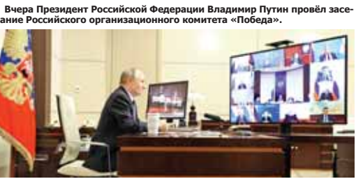
Вчера Президент Российской Федерации Владимир Путин провёл заседание Российского организационного комитета «Победа».

Заседание открывает год 80-летия Великой Победы – её значимость в судьбе страны, в характере и ценностях всего нашего народа постигне колоссальна, – подчеркнул В.В. Путин, открывая встречу. В знак нашей неизменной памяти о событиях Великой Отечественной войны и о грандиозной Победе над нацизмом, как символ неразрывной преемственности поколений 2025-й объявлен в России Годом защитника Отечества. Защита Отечества, служение Отечеству во все времена были и остаются для нас священным делом. Эти чувства любви к Родине, ответственности за неё объединяют наше общество. Каждый гражданин России вносит свой вклад в сохранение родной страны, своим трудом, достижениями в науке, культуре и просвещении, в экономике и промышленности, на ратном поприще, создаёт её уверенное и стабильное развитие на ближайшую и отдалённую историческую перспективу.