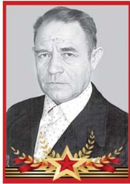
Смыков Фёдор Степанович