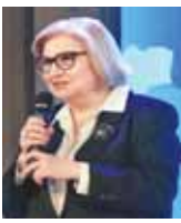
Профессионализм, чуткость и преданность своему делу, помогая детям с особенностями развития раскрывать свой потенциал.