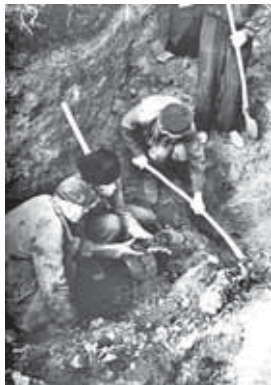
Останки расстрелянных в с. Зольском 14 декабря 1942 г.