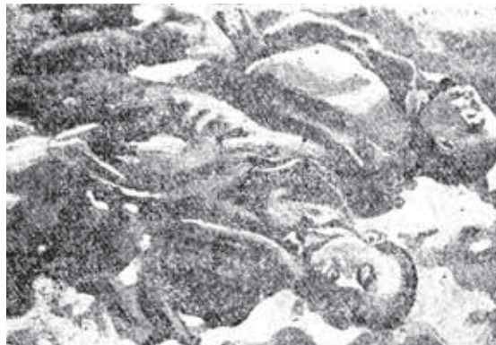
Фото из газеты. Жертвы фашистского террора у противотанкового рва на подступах к Нальчику

В первые же дни оккупации прошли массовые аресты. Местом расстрела выбрали территорию вблизи аэропорта «Нальчик», впоследствии там было обнаружено больше 600 тел жителей республики, часть из них была сильно изуродована. Их подверг-