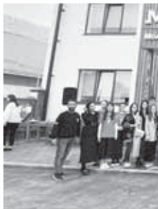
Ребёнок из Черекского района

В 2022 году были завершены масштабные мероприятия по улучшению медицинской инфраструктуры района. В рамках региональной программы «Модернизация первичного звена здравоохранения» завершён капитальный ремонт поликлинического отделения центральной районной больницы. Построено новое здание амбулатории в Аушгере. Активно реализуется программа «Земский доктор», в рамках которой в район направлены врачи-педиатры участковые, врач-хирург,