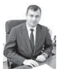
(Ожидание Начало на 1-й с.)

Производство куринных яиц за аналогичный период достигло 462,5 млн. штук – это на 5,6% больше, чем годом ранее и в три раза больше, чем в январе-ноябре 2025 года. В частности, на душу населения за январь-ноябрь 2025 года в регионе произведено около 40 килограммов мяса птицы (против 450 штук куринных яиц (против 450 штук в среднем по России)). Также цифры официальной статистики являются реальными подтверждением того факта, что республика превосходит