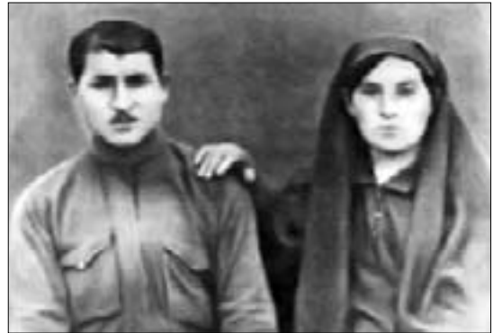
Отец композитора Кубати с сестрой Гошаной

У меня музыка о детях – это печальный мажор (или, как я называю, кабардинский мажор). Но я счастлив тем, что хоть одна моя песня останется детям. И в основе моей самой серьезной музыки лежит колыбельная песня из