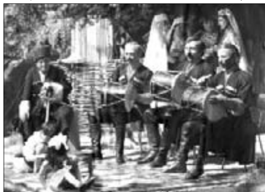
Служение искусству стало их общей целью

тропировал в летние месяцы (когда у детей были каникулы) по Кабардино-Балкарии, Адыгеи и Карачаево-Черкесии. Они пели на кабардинском, балкарском и русском языках, успешно пользовались немомовыми.