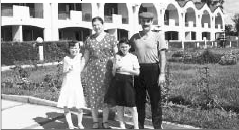
Прогулка всей семьей перед посольством

обязанности распределены: кто-то только готовит, кто-то занимается исключительно стиркой, кто-то вышивает. Дети родную маму никак не выделяют: все жены отца – их мамы в равной степени.