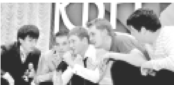
Оюнга катышканылы кыаууму.