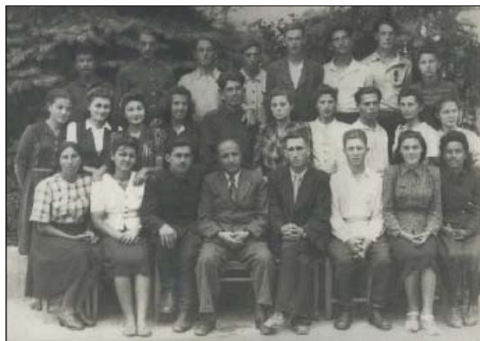
Хъэжбэчыр (сэмэуэмкIэ кыщыщIэдзауэ ещанэу щысщ) консерваторэм щезыгъэджэхэмрэ кыIдеджэхэмрэ я гъусэщ. 1947 гъэ

консерваторэ цларыуэм кыщызэрагъэпэща Адыгэ студием щеджэну ягъаклуэ ди щалэгъуалэ гупышхуэм.