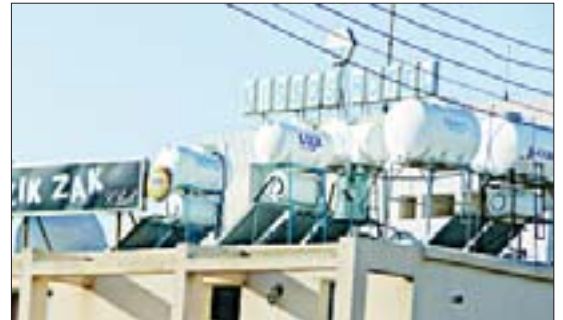
Солнечные батареи и емкости с водой на крыше гостиницы Киссос, г. Пафос