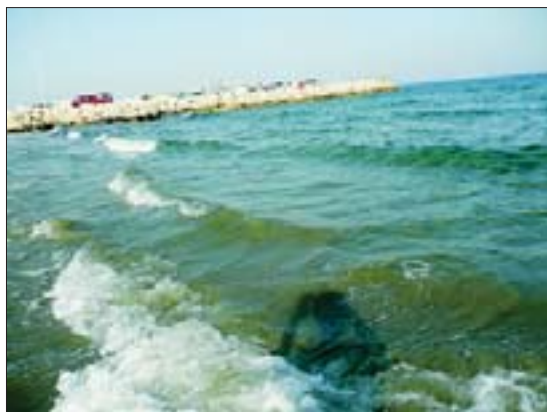
Средиземное море в районе г. Ларнака

Одно из основных природных богатств острова – знаменитые кипрские леса, которые растут в основном по склонам и вершинам многочисленных отрогов главной горной гряды острова. Фауна Кипра беднее его флоры. Но можно встретить лис и зайцев. Дикие бараны муфлоны занесены в Красную книгу. Много мелких пресмыкающихся – ящериц и змей, которые встречаются почти повсеместно.