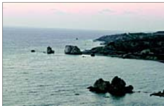
Побережье Средиземного моря недалеко от Пафоса. Место рождения Афродиты