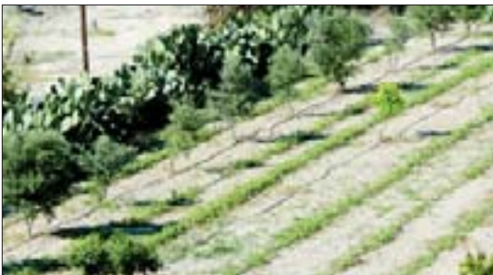
Оросительные системы в Пафосе