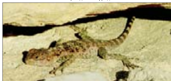
Средиземноморский геккон в прибрежных скалах, г. Пафос