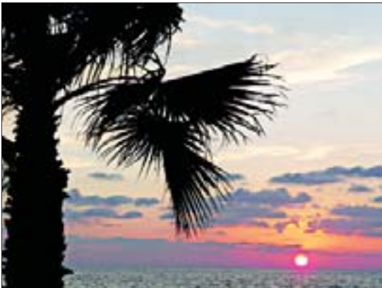
Закат солнца на Средиземном море