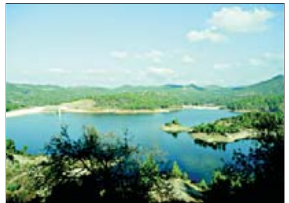
Водохранилище в горах Троодоса

На Кипре, как и в других странах Средиземноморья, культивируют оливы, цитрусовые, виноград, миндаль, яблони, персики. В структуре их возделывания оливы занимают важное место, некоторые из них растут уже более 800 лет. Такие оливы являются природными униками, настоящими ботаническими памятниками острова. Оливковые плантации занимают обширные площади на равнинах, прибрежных низменностях, на пологих склонах, платообразных массивах в горах. Даже небольшие рощи выращивают в пределах городских территорий, на приусадебных участках. Оливковые деревья бывают высокоурожайными. Плоды созревают осенью. Кроны, особенно у молодых олив настолько густые из-за большого количества ветвей, что сильно затрудняют уход за ними, особенно сбор плодов. Зеленые плоды оливы бывают плотно напизанными на ветвях, как бусы на нитке. Поэтому зеленую гриву дерева приходится на самом деле расчесывать специальным садовым инвентарем. На землю растилают скатерть или полиэтиленовую пленку, куда плоды падают.