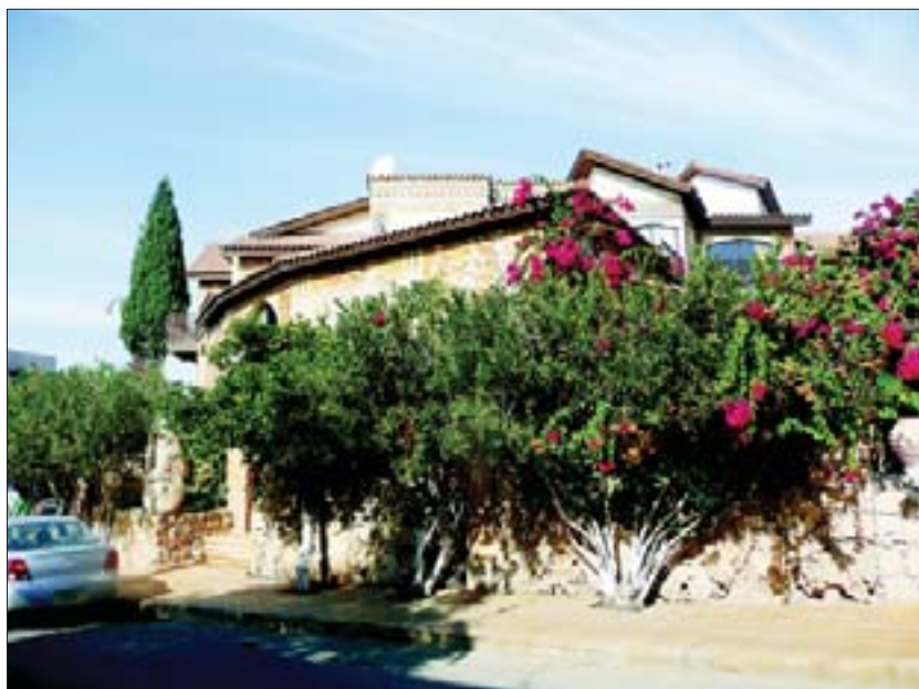
На улицах Пафоса