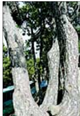
Сосна аллепская в Троодосе на высоте более 1850 м