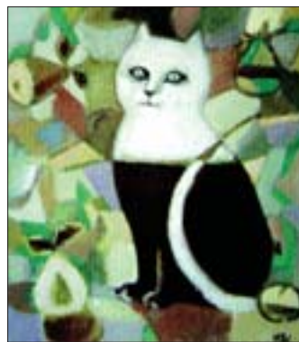
«Кот с грушами»

Для ушастой «Египетской кошки» безошибочно найден блеклый нейтральный фон, оживленный узорочьем нежно-розовых цветочков, которые привносят в холст поэзию и очарование. Свообразие цветовых сочетаний и разнообразие ритмов вызывает у зрителя музыкальные ассоциации. Поиски свежих пластических красок увенчиваются удачей и в холсте «Аквариумный кот». Фоном служит абстрактный мотив, сотканный как бы из вибрирующего света, разложенного призмой на несколько тонов. Основной цветовой мотив представляет собой сложное переплетение розовых, бледно-зеленых, блеклых лиловых тонов. В общем, для произведения характерны вариации ос-