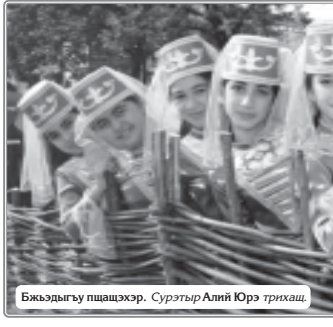
Бекхаджы пшашхэр. Суртэр Аий Юрэ тринх.

Гземауэ ушш. Берже Адольф, Илэситху дакин, 1866 гэм, Нэгүмэ и «Тхыдэр» (Германи дунем кыдылдуу шыр).