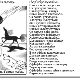
Нэгүмэ Умар кызыралтхурэ илгэс 85-рэ ироккү.