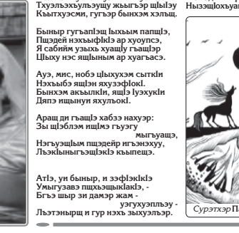
Нэгүмэ Умар кызыралтхурэ илгэс 85-рэ ироккү.