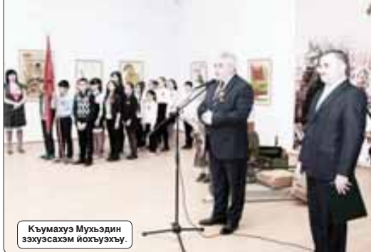
Кумухуэ Мухэдин зэуусэхэм иохуэгуэ.