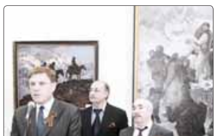
Пащты Борис и псалэ.