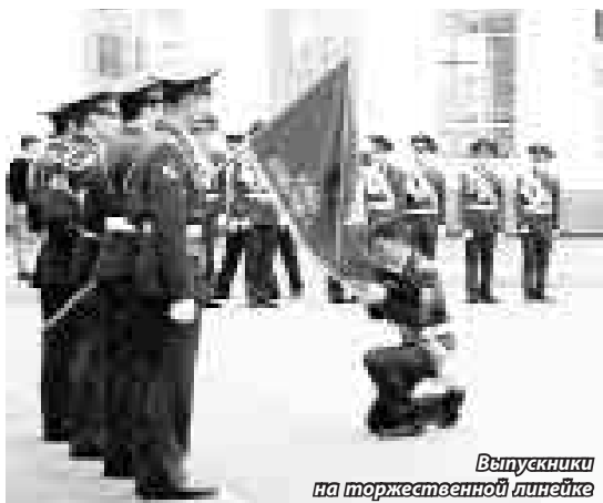
Выпускники на торжественной линейке

всем, но потом режим становится привычной частью жизни для большинства, те, кто так и не смог его принять, уходят.