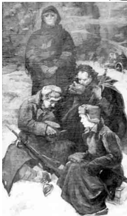
А. Сундуков. «Мать солдатская», 1967 г.

Зародившаяся на фронтовых дорогах, дошедшая до наших дней в быстрых фронтовых рисунках и памяти воевавшего художника тема заполняет всю