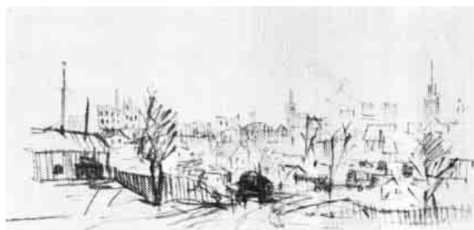
А. Сундуков. «Вступают в Гродно. Второй Белорусский фронт», 1944 г.

«Переправа через Неман», 1944 г. «Сарны», 1944 г. «Разрушенный Слоним», 1944 г. «Танки в Слониме», 1944 г.