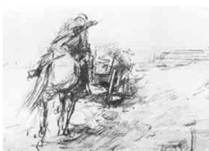
А. Сундуков. «В походе. Северо-Кавказский фронт», 1943 г.