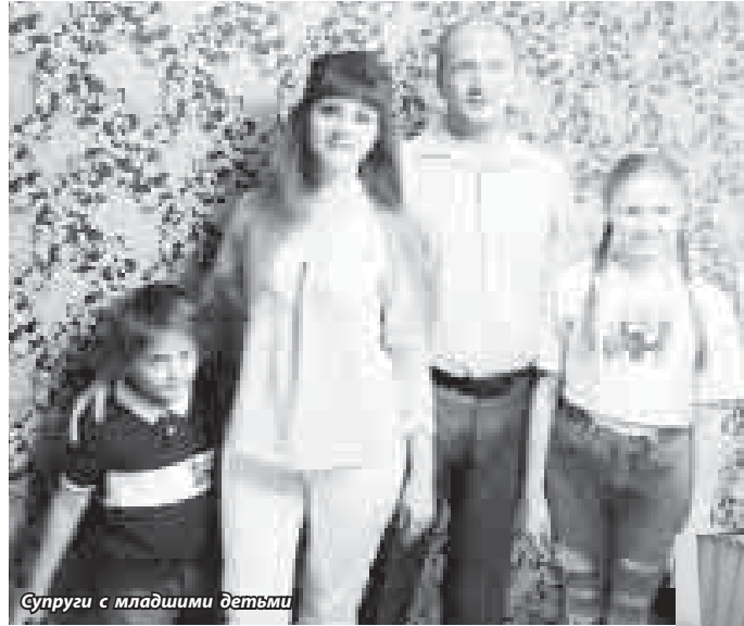
Супруги с младшими детьми

Отец как профессиональный сварщик часто ездил вместе с нами на разные строительные объекты, где можно было получше заработать. Так мы оказались