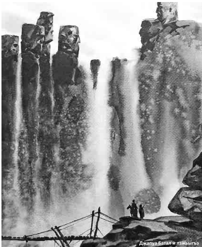
Джапуа Батал и лэжыгыэ

Д. Саутурорт, (Лондонда чыгыуучу «Дейли Мейл» газетден). Кьазакь тилден Жулабаны Юзейир кечоргенди