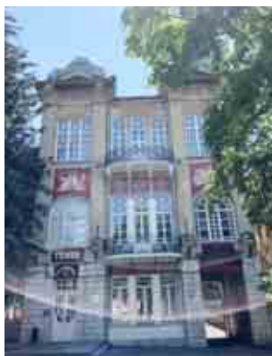
(Окончание. Начало в 32 номере)

На следующий день можно пойти по маршруту, который охватит новые интересные места. По такому пути мы часто отправлялись гулять по городу на выходных. Начать можно с парка «Цветники», на территории которого расположено много известных достопримечательностей. Это замечательное место для променада, которое пятигорчане называют Бродвеем. Над его благоустройством трудились братья Бернардацци, те самые, которые участвовали в строительстве Исаакиевского собора. Гуляя по парку, можно увидеть красивое историческое здание. Это кофейня Гукасова, перед которой просит милостыню всем известный Киса Воробьянинов.