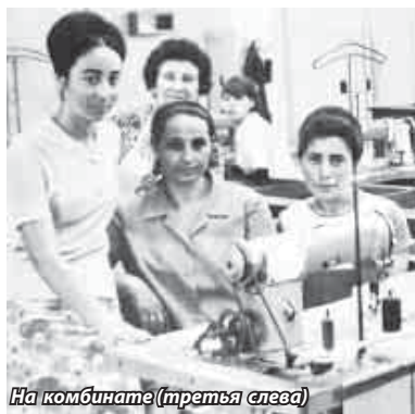
На комбинате (третья слева)

С мужем мы прожили тридцать пять лет, хорошо, дружно. Четыре года назад его не стало. После