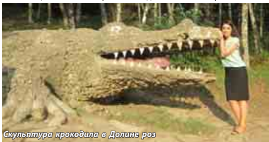
Скульптура крокодила в Долине роз

Этим не ограничивается список всех объектов, которые имеются в арсенале Кисловодского национального парка.