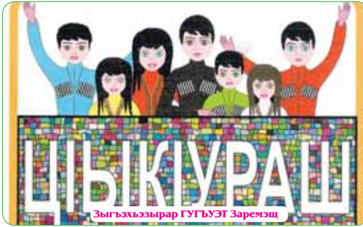
Зыгъэхэзырар ГУГҮЭТ Заремэц