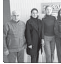
хуиц зэвхэмэр тхыгэуэ...