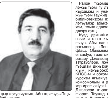
шылэжэжэм нэгүшү. Абы шыггыи «Падый» хууат.