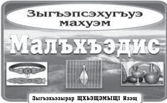
Зыгъэхъзырар ЦХЪЭЦЪМЫШЦІ Изэц