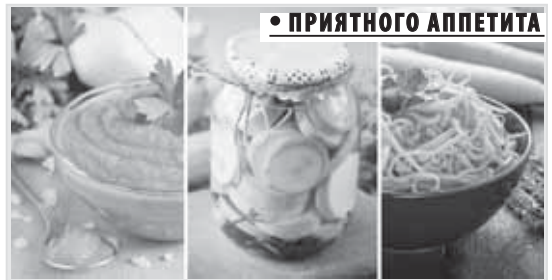
Фото Тамары Ардавовай