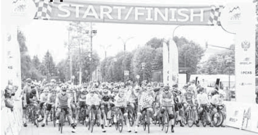
В прошлые выходные в КБР прошли седьмой и восьмой этапы 32-й многодневной велогонки «Дружбы народов Северного Кавказа» чемпионата России по велосипедному спорту на шоссе в рамках федерального проекта «Спорт – норма жизни» национального проекта «Демография».

«Для нас велосипедный спорт, конечно, связан с памятью о выдающихся победах нашего земляка, чемпиона Олимпийских игр 1972 года в Мюнхене, чемпиона мира по велоспорту – легендарного Бориса Шухова. И сейчас в Кабардино-Балкарии немало любителей велосипедного спорта, Федера-