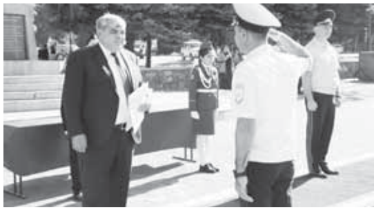
Подготовила Ольга КАЛАШНИКОВА

Глава КБР Казбек КОКОВ и министр внутренних дел по КБР Вячеслав КРЮЧКОВ вручили подразделениям ключи от новых патрульных и служебных автомашин. Впервые дороги республики будут патрулировать автомобиль, оснащенный бортовым аппаратно-программным комплексом «Кибер-шериф». Его функции и задачи многопрофильны, а каналы связи способны обеспечить автоматическое взаимодействие с базами данных различных государственных структур. Всего в регион поставлена 51 единица современного специализированного автотранспорта. Новые машины переданы в том числе в районные отделения МВД по КБР. В целом оснащенность подразделений ми-