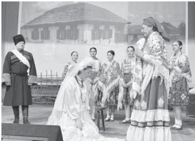
Межмуниципальный фестиваль-конкурс «День матери - казачки», приуроченный к Всероссийскому дню матери, прошел в г. Майском в ДК «Россия». В программу праздника вошел показ конкурсных программ - выставки традиционной казачьей культуры, демонстрация бытовых обрядов и сценок из жизни казачек, выступления народных казачьих коллективов.

При этом женщина-казачка никогда не теряла женственности, сердечности, кокетства и любви к нарядам. О казачках современники писали: «Соедините красоту и обаяние русской женщины с красотой черкешенки, турчанки и татарки, да если прибавить бесстрашие амазонок - перед вами портрет истинной казачки». Казачий род выстоял и приумножился именно благодаря силе, любви и крепости духа казачек. Можно много и долго говорить о роли матери-казачки в истории, семье и возрождении казачества. Суть будет одна: истинная казачка всегда посвящает себя мужу, дому и детям и при этом растит достойных защитников Отечества. Так было, так есть и так будет всегда. В дальнейшем день матери-казачки стал считаться днем поминовения