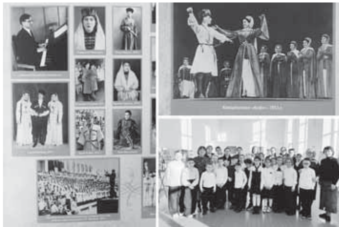
Уникальная передвижная фотовыставка «Истоки. Из истории становления профессионального музыкального искусства Кабардино-Балкарии» была создана на базе Северо-Кавказского государственного института искусств. Проект реализован в рамках гранта Президента Российской Федерации для поддержки творческих проектов общенационального значения в области культуры и искусств.

Сотрудники Управления по делам искусств выезжали в районы республики, отбирая одаренных юношей и девушек. Желающих поехать на учебу в Ленинград было много, комиссия прослушала более ста претендентов. Поскольку у большинства абитуриентов не было музыкальной