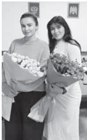
Подготовила Дина АЙДАНОВА

По завершению встречи участники выразили уверенность, что достижения Алины и Карины послужат вдохновением для новых поколений альпинистов и спортсменов в целом.