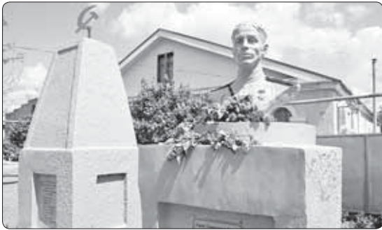
Жыи шцэи кыфлэлыкыу цытауэ жайэж.

Айдэмыр флэгэщцэглэгэун дьдэт кээзыуэреихь дунейм и ухуклэр, абы и шцэхуэр зригэщцэну хуцлэкэурт, бгыхэм дэжыныр, луащхэхэм клэрыхэныр, псыхуэжэм шыцэхэ-зеклуэныр зыхилхэхэ шылэтэ-кыбм. Шапсыг нэхьыжкыэм кыабгэздыхауэ шалыуа жкым и дэтхэнэ шылэпэм тейуха хыбар бжыгэншэхэм шыгуаэзэт, удихэхэиуи кыилуэтэжыфурт. «Ачмыжкэ я шалэм Шапсыг-гыр кыкыуэныжыну и хыбары гүклэ зерегээзаухэ», - жалеуи шцэжым цыхур кыехуа-псэу гурхуауэт. Арагэнууц лэпкэ луэрылуэтэхэр зехуа-хэсыжыну шапсыг лыхъужым я деж квалкуэ шцэныгэллэхэр ялэщылкэ Айдэмыр луцлэу, зытеклуэла луэхум и кыөгэжжаплэ хынуар абы деж шыцэрагэпэцу шыщытыр.