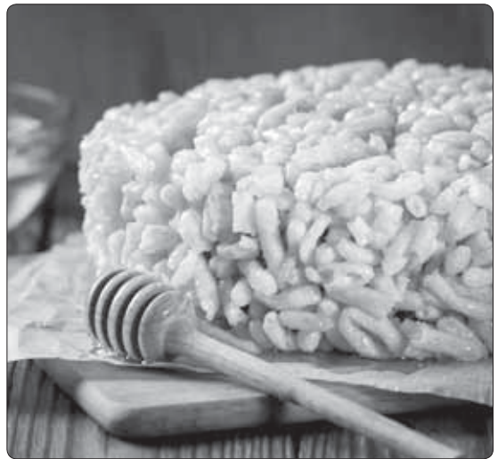
гъуэ - г 530-рэ, джӀэдэкӀуэ - 5, гъуыгъуэ - г 20, шатӀуэ - г 80, содэу - г 6, шыгъуу - г 4. Фошы-гъуыс: фоуэ - г 300, фошы-гъуу - г 100. ЗӀагъэжӀану да-гъуэ - узьхуейм хуэдзи.