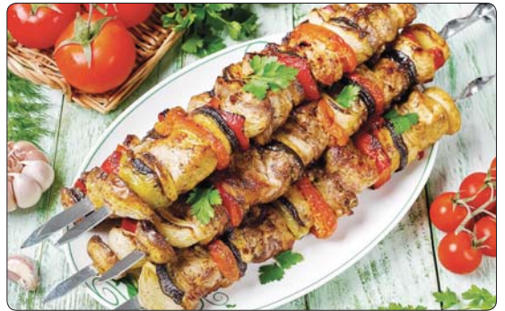
Халъхъэхэр (цыхуитӀ лъхъэ): мзлылу - г 250-рз, адыгэ бжын пльыжэ цыкӀуу - г 150-рз, шы-

ЛыпцӀэр зеплаупцӀ г 35 - 40 хъуу. Адыгэ бжын пльыжэ цыкӀур аукъэбэ, лыри бжынри псы щӀыплӀэкӀэ ятхъэщӀри дзэху тепщӀэным иралъхъэ, шыгу, шыбжый сыр хаудари фыуэ зӀла-щӀэж. И шхъэр теплауэ щӀылапӀэм деж цагъэт дакыкӀэ 15 - 20-кӀэ. ИтӀанэ лы тыкӀыр цыкӀуэхари бжынри хъыдан гъушкӀэ ялӀэщӀи. Цагъэжъэным и деж ялӀэ щӀыкӀэ дзасэм лы тыкӀыр фӀалъхъэ, итӀанэ бжын псо, апхуэдэрэ дзасэм фӀэз ящӀи, и кӀэ дьдэм фӀэлын хуейр лы тыкӀырщ. Пхъэ мафӀэ дӀэкӀэ, дзасэр ягъэклӀрахуэуэрэ, ягъа-жъэ, лыр хъэзыр, тхъуэллӀ дахэ хъухуекӀэ. Дзасэм къыфӀальэфри пщӀыру тепщӀэным иралъхъэ. Дашх пластэ, мырамысэ, чыр-жын, хъэлапэмэ, щӀакхъуэ. ШӀэ хуабэ трафыхъыж. Сэбзышхуэ арухъу псчарейхэм, лӀпс бзаджэ зилӀэхэм, щӀыӀэ зыхыбӀэхэм.