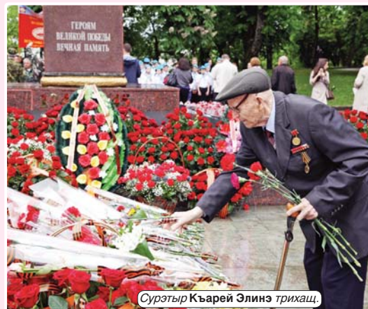
Сурэтър Къарей Элинэ трихаш.

МахуэшхуэмкIэ сынывохуэхуэ, си лъахэгъу лъапIэхэ! Теклуэныгъэм и махуэмкIэ!