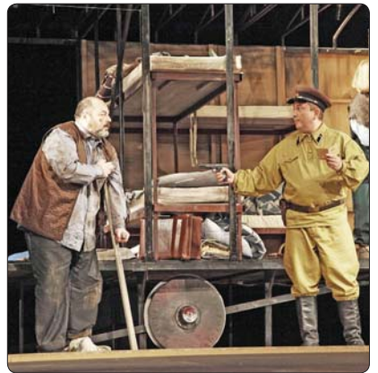
Гьэклэ куэдэи мыхъуэ, я дыхъош макъы щызыэхэл-хьэр.

Зауэм теухуа лэжыгъэхэм къащхьэщыкылуэ, «Эшелон» спектаклым нэхуэгъэклэ, гушылэклэ, гу-гъэклэ гъэнцлэщ. Арац театреллэхэм нэпс цлэ-