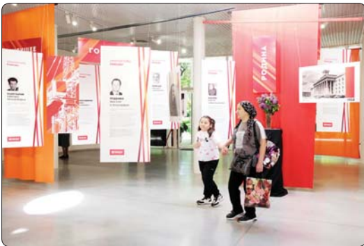
Ди газетым и къыкълэпыкыуэ номеры къыщыдэжынуэр накъыгъэм и 12-рц