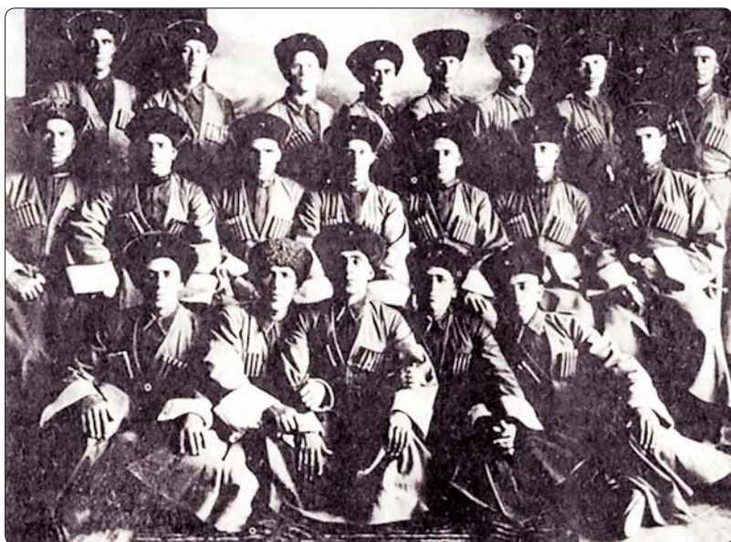
115-нэ Къабэрдей-Балъкъэр шу дивизим и зауэллэр.

Ахэр шауклар мыбдже дыдэрщ, аращ 1947 гъэм фашизмэм ІэщІэкІуэдахэм я фэеплэуэ зауэхуэну мы щыІпІэр къыщІыхахэр. Абы тет-хаш: «Фашист лэйсэхъуэм Къэбэрдей-Балъкъэрныр щаубыдам щыгъуэ якІуа цІыху 600-м я фэеплэу». Дэ ахэр эзи тыгыпщэн-у-къым, абыхэм ирацари дгъэгъунукъым. Хейуэ хэкІуэдахэм ахърэт нэху Тхэм къарит».