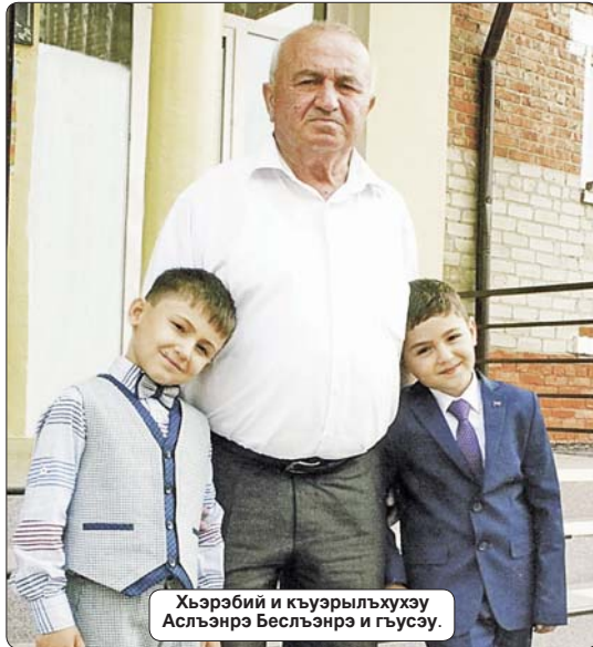
Хьэрэбий и кьуэрльхуэху Аслъэрэ Бесльэнрэ и гъусэу.

Урыс тхаклюэ цэрлыуэ Толстой Лев жылэгъаш: «Сабийхэр фһуэуэ зылагуэ егъэджаклюэр адэ-анэм ешхьш - ар нэхьыфлщ шэныгъэхуэуэ зилэ, ауэ цыкълүжэм яхуэгушылэ егъэджаклюэм нэхьэр. Егъэджаклюэм шэныгъэфл бгъэдэлэрэ сабийхэри фһуэуэ ильагуэмэ, апхуэдэрэщ егъэджаклюэ нэсклэ узэдженур». А цыхуэ шэджашэм и псалгъэхэр епхьэллэ хьунуш егъэджэныгъэ-гъэсэнныгъэ Іэнатлэ мытыншым жэупалныгъэр зыхишюу пэрят Дидан Хьэрэбий Сэфарбий и кьюэм. И шіалэгъуэм епсклэ кьыхихауэ шыта Іэщлагъэм емышчыжа, и лэжыгъэм темызашэ, ар езыгъэфлаклюэ Іуэхуэгуэжэм я зэхуэблаклюэ а цыхуэ шыпкьэр зэманымрэ шіэблэмрэ ядобакьюэ. Егъэджэныгъэм и ветеран нэхьыжыфлыр махуэ кьэс и лэжыгъэм пэрхьэ, кьаруушцэрэ жэрдэмьшцэрэ и куэдэ, и нэзэм шіэт ныбжыщлэхэм шэныгъэм и лэбжэ бьдэр ягъэтылынымыккэ, едженым гукьыдэж хуэлэрэ абы теклуэныгъэ цыкълүхэр кьышхьафлур иргьагъэу. Шіэблэм шэныгъэ етынымрэ лэпкь гъэсэнныгъэ тэмэм ягъэлхьэнымырэ зи гъашцэр хуэзыгъэлэса Диданьр Іэнатлэм зэрпэрэйтрэ мы гъэм ильэс 50 ірокуэ.