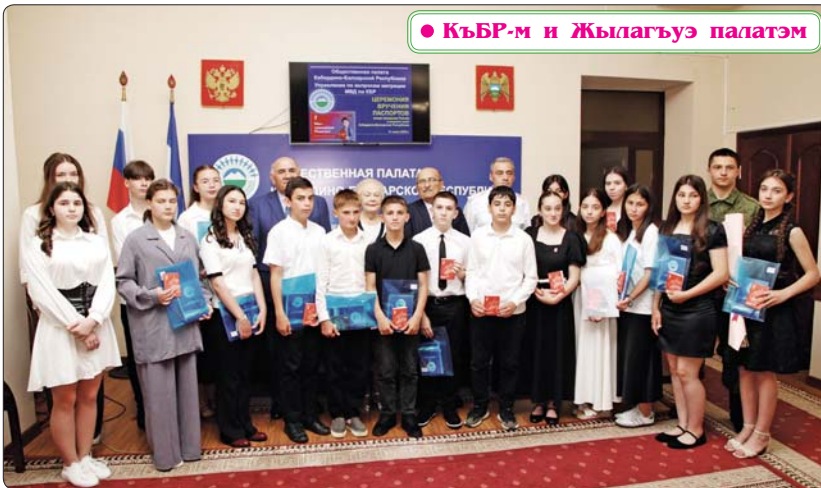
• КЪБР-м и Жылагъуэ палатэм

Тэклу дызэлэбжыжынщи, Урысейм и махуэ зыфлащам и къежэклэ хуам клэщлу дьтеспэлыхьынщи. И къуанхуэцлэ хуари, тхыдэм къызэрхъэщыжымкцэ, гъэщцэгъуэщц. Лэщцэгъуэ блэклэм и 90 гэхэм, зэрьтщцэщи, Совет Союзу щытам хьыцэ республикэхэр, зым иужь адрейр иту, къэрал абрагъуэм хамытыжу щхьэхуит хьурт. Ауэрэ здеклуэжым, 1990 гъэм мэкъуауэгъуэм и 12-м РСФСР-м и цыхуэбэ депутатхэм я япэ зэхуэсышхуэм (съездым) лэ щытрадзаш Урысей Федерациэр къэрал щхьэхуэ зэрхьытам теухуа дэфтарым. Илъэсиплэ дэкри, 1994 гъэм Президент Ельцин Борис и унафэцлэ, мэкъуауэгъуэм и 12-р РСФСР къэралыгъуэр хуит щыхъужа (Союзым хэта адрей