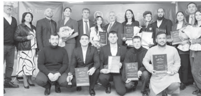
(Продолжение на 11-й с.)

«Лидер сообщества», «Друзья КБР», «Хранитель культуры», «Ключевое слово» и «Спортсмен года». В каждой из них определялся победитель, проживающий и реализующий себя в республике и за ее пределами.