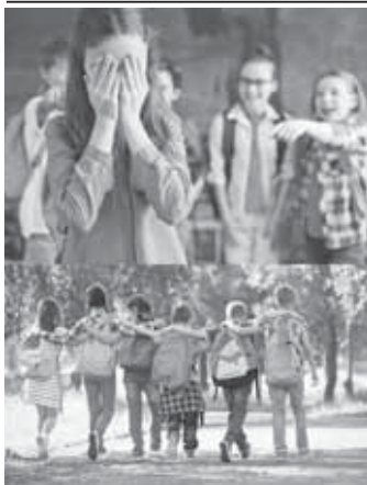
(Окончание. Начало в № 5)

Домашнее обучение может потребовать значительных затрат на приобретение учебных материалов и оплату образовательных услуг, а это большая нагрузка для семей с ограниченным бюджетом.