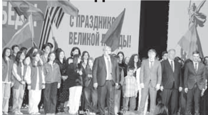
В столице Кабардино-Балкарии на прошлой неделе открылся крупнейший на Северном Кавказе Республиканский дом молодежи. В тот же день молодежные центры были торжественно запущены в Майском и Эльбрусском районах.

Дом молодежи создан в рамках программы комплексного развития молодежной политики «Регион для молодых». Организаторы отмечают, что он станет площадкой для творческого самовыражения и развития. Каждый метр трехэтажного здания отведен под различные креативные