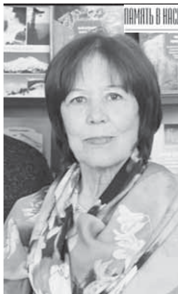
ПАМЯТЬ В НАСЛЕДСТВО