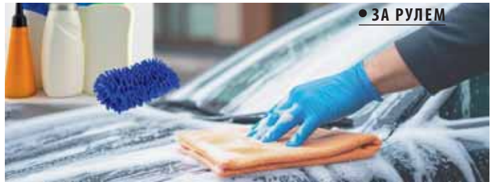
● ЗА РУЛЕМ