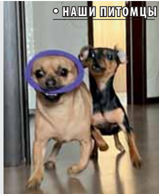
○ НАШИ ПИТОМЦЫ

Собаки не привередливы и чистоплотны. Не очень любят купаться, но