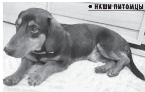
• НАШИ ПИТОМЦЫ

Питомец очень общительный, любит всех и знакомых, и незнакомых людей. Иногда нам даже приходится оттаксывать его от них. Во время очередной прогулки одна девочка примерно пяти лет назвала нашего пса милешечным. С тех пор у него появилась еще одна кличка - мистер Милешечный. Пес отзывается на все