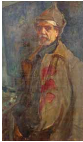
Автопортрет, 1984 г.

В фонде музея хранится более двухсот рисунков и эскизов на пожелтевшей бумаге. Совершенно гениальные военные зарисовки, в которых отображены не только батальные сцены, но и портреты сослуживцев, были созданы в редкие минуты затишья. Кто как не прошедший через войну художник мог так живо и правдоподобно передать события тех лет. На протяжении творческого пути он не раз возвращался к событиям военных лет, раскрывая новые сюжеты в полотнах «Оборона Кавказа», «В окопах», «Партизаны в походе», «В штабе» и других. Среди работ этой тематики особенно выделяются сюжеты, в центре которых - образ лошади. Художник изображает лошадь крупным планом, органично вписывает ее в сюжет военного действия в качестве важной составляющей части. «Эпизод Великой Отечественной войны» - картина «со звуком». Клубы серого и черного дыма, пепельное небо, на котором различимы вражеские самолеты, посреди зеленого поля стоит лошадь, поза которой выражает застывшее отчаяние. За ней разбитая повозка, а