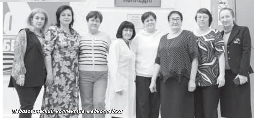
Педагогический коллектив медколледжа

Сложно представить более значимую профессию, чем медработник. Для каждого из нас здоровье – величайшая ценность. Поэтому с глубоким уважением смотрим на тех, кто предан делу служения медицине. 12 мая в России отмечается День медицинской сестры. Мы расскажем о сегодняшнем дне старейшего в республике медицинского учебного заведения среднего профессионального образования – медицинском колледже КБГУ.