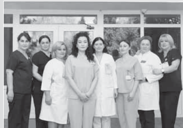
Выпускники медколледжа разных лет

ся на каждого. Старшие медсестры делают все, чтобы мы успешно прошли аккредитацию и получили сертификат качества. Студенческие годы вспоминаем с теплом. Медучилище считалось одним из лучших на Северном Кавказе, мы гордимся своим образованием».