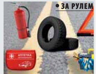
• ЗА РУЛЕМ

А вы знаете, какие предметы обязательно должны быть в автомобиле? Запасное колесо, аптечка, набор инструментов, огнетушитель, лопата, подушка безопасности, манометр, знак аварийной остановки, насос, кнопочный телефон, домкрат, световозвращающий жилет и провода для прикуривателя. Что из перечисленного у вас есть? В моей машине всего три предмета и вместо световозвращающего жилета только полоски, которые надеваются на руки или ноги. Еще дома имеются электрический насос и домкрат. А еще задумался над тем, зачем мне манометр. Да, он нужен для измерения давления в шинах, но обычно делаю это в шиномонтажных мастерских, так как доверяю профессионалам своего дела. Давление в шинах влияет на безопасность, управляемость автомобиля и экономию топлива. Например, при недостаточном давлении увеличивается сопротивление качению, что приводит к повышенному износу резины и росту расхода горючего. При избыточном давлении шины ухудшается сцепление с дорогой, что делает езду менее комфортной. А оптимальное давление, указанное производителем, обеспечивает баланс между долговечностью шин, безопасностью и эффективностью. Остальными функциями манометра не смогу воспользоваться. Например, не смогу проверить давление масла в двигателе. Хотя... можно и научиться, это будет не лишним.