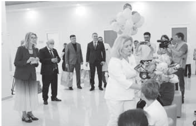
В Международный день защиты детей депутаты Парламента КБР и парламентарии посетили подшефные республиканские учреждения для детей-сирот и детей, оставшихся без попечения родителей, сообщает пресс-служба законодательного органа республики.

– В отделении находятся дети с тяжелыми заболеваниями, которые проходят сложное лечение. Это порыв души – приехать к ним и поздравить. Праздник замечательный, потому что это возможность еще раз обратить внимание общественности, органов власти и институтов гражданского общества на проблемы детей. К сожалению, проблем немало, надо общими усилиями их решать, потому что дети – самое ценное,