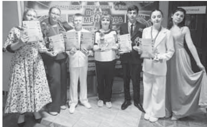
Образцовый вокальный ансамбль «Мечта» вернулся с XII международного конкурса дарований и талантов в проекте «Времена года» - «Летний калейдоскоп-2025» с призами и новыми лауреатами.

Мы приехали немного раньше начала своего блока, чтобы познакомиться с уровнем конкурса и поучиться у других. Признаться честно, это была тяжелая борьба. Оргкомитетом было принято более 160 заявок, конкурентов много, выступления конкурсантов интересные, с грамотной подборкой программой. Это давало четкое понимание, что выкладываться нужно так,