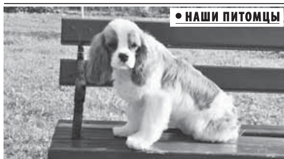
• НАШИ ПИТОМЦЫ