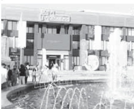
28 июня масштабным праздником в Нальчике и муниципальных районах республики отметили День молодежи - праздник молодости, энергии и стремления к переменам. Он превратился в яркий фестиваль, охвативший несколько площадок, где гостям были предложены разные активности.

Особое внимание привлекли площадки, посвященные патристическому воспитанию. В Ореховой роще развер-