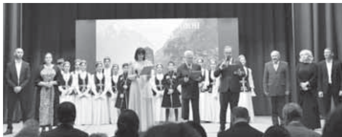
На прошлой неделе Черекский район отметил свое 90-летие. 28 января 1935 года президиум Кабардино-Балкарского областного исполкома издал постановление об образовании района из разрозненных поселений и территорий проживания, в основном балкарцев и кабардинцев.

От имени депутатов жителей района поздравила Председатель Парламента КБР Татьяна ЕГОРОВА. Она отметила, что Черекский район - один из самых высокогорных в республике, обладающий уникальными природными и историческими достопримечательностями. «Люди, живущие здесь, соответствуют этой уникальности. Среди них - герои войны и труда, деятели культуры, науки, искусства, спортсмены. История Черекского района богата именами известных людей, которые внесли значительный вклад в развитие республики. Каждый из вас делает все возмож-