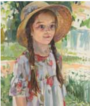
Девочка в соломенной шляпке

Художник стремится передать не внешнее сходство и достоверное изображение конкретного места, а наполняет образы невесомым чувством