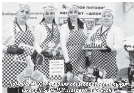
Команда МКОУ «Средняя общеобразовательная школа №5 им. Н.И. Нагоева» г. Баксана

В городе Гатчина Ленинградской области состоялся V юбилейный всероссийский конкурс «Лучшая школьная столовая-2025». Мероприятие объединило представителей более 70 субъектов нашей страны. Среди них были и две команды из Кабардино-Балкарии, ставшие лауреатами конкурса в разных номинациях.