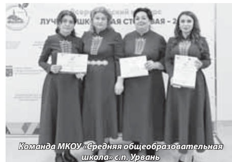
Команда МКОУ «Средняя общеобразовательная школа» с.п. Урвань

В рамках деловой программы конкурса состоялась V всероссийская научно-практическая конференция «Школьная столовая как экосистема здорового питания обучающихся». На мероприятии